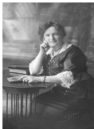
Madame Nellie McClung