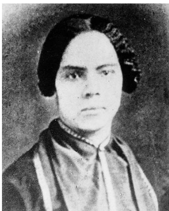
Madame Mary Ann Shadd