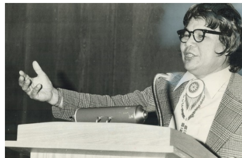
Monsieur George Manuel, OC, LLD

Pour les Premières Nations , les membres ne voulaient pas perdre leur statut et cesser d'être reconnus comme nations ou peuples distincts. Ils ne voulaient pas être assimilés à la société non autochtone. Aussi, en votant aux élections canadiennes, ils participeraient à un système étranger au leur, alors qu'ils avaient déjà leur propre système de gouvernance.