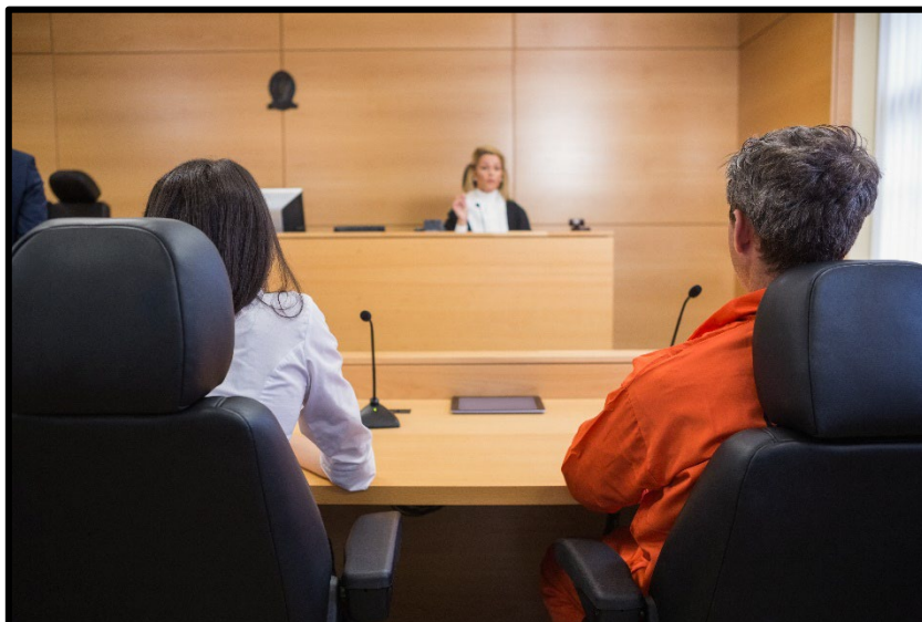
FICHE DE L'ÉLÈVE