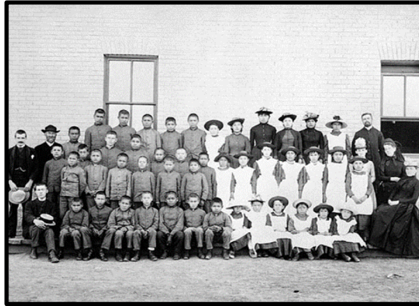
Enfants à l'école résidentielle St-Paul à Middlechurch, au Manitoba, en 1901

ⓘ À noter que ces événements se sont produits avant l'adoption de la Charte canadienne des droits et libertés, en 1982.