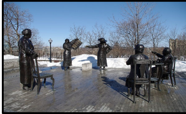
Statues des Cinq Femmes Célèbres au Parlement d'Ottawa — © John B. Codrington