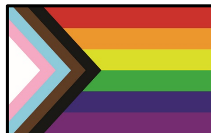
Drapeau créé par l'artiste américain Daniel Quasar. Il contient les bandes et couleurs du drapeau classique, les pastels du drapeau transgenre et le brun et le noir, symbole des minorités visibles