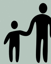
Membre de la famille