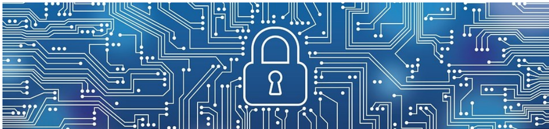
Circuits avec un cadenas

Des gestes simples peuvent t'aider à avoir le contrôle de ta vie privée en ligne. Nous te proposons de :