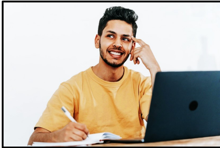
Jeune qui utilise un ordinateur portable