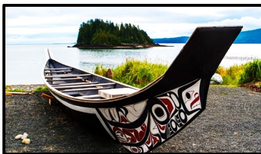
Canoé du peuple Haïda à Haïda Gwaïi en Colombie- Britannique — © Colin.

Pour comprendre les pensionnats autochtones, il faut comprendre la culture autochtone avant l'arrivée des colons européens. La culture et certaines traditions autochtones sont toujours existantes aujourd'hui, malgré les défis affrontés par les peuples autochtones.